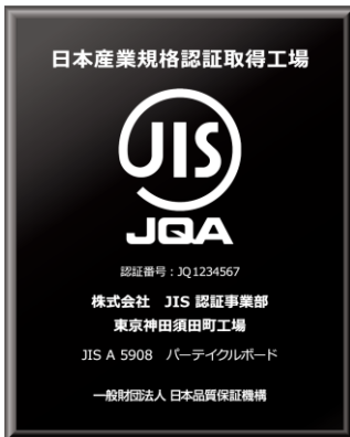
標準バージョン 直接印字