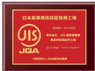
標準バージョン アルミプレート印字 (金または銀)