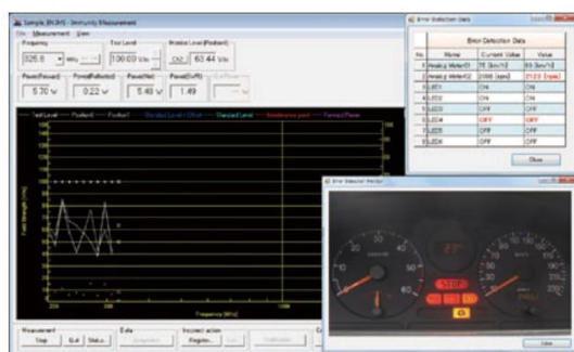
イミュニティ試験ソフトウェアおよびEUT誤動作検知機能（イメージ）

AWGNをはじめとする複数の妨害波変調方式に対応できる、専用試験システムおよび試験ソフトウェアを導入しています。イミュニティ試験ソフトウェアは、同一試験周波数ポイントにおいて、複数の妨害波変調方式をシーケンシャルに切り替えることができ、妨害波出力について、任意の出力時間設定を含むON/OFF切り替えにも対応しています。