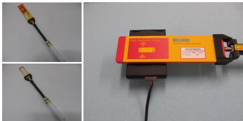
広帯域スリーブアンテナ（2種類）およびアンテナ近接照射試験の様子

自動車メーカーとEMC試験器メーカーが共同開発したプレート型広帯域スリーブアンテナは、ISO 11452-9:2021で新たに採択され、一部の自動車メーカー規格においても採用されているものです。当機構においても周波数帯域別に2種類のアンテナを導入し、広いマイクロ波帯域（0.7 - 6 GHz）をカバーする広帯域放射試験を、低VSWR (Voltage Standing Wave Ratio: 電圧定在波比)で実現します。