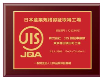
標準バージョン アルミプレート貼付け