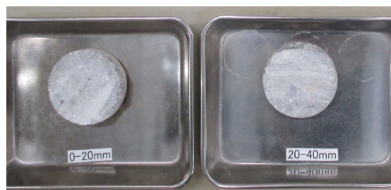
加工後のコンクリート供試体 (20 mmピッチでカット)