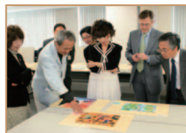
第8回コンテストの審査風景。 中央は黒柳徹子氏