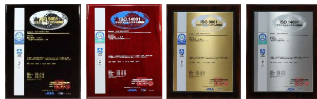
・ピアノフィニッシュ登録証