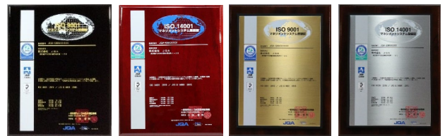
・ピアノフィニッシュ登録証楯 ・木製登録証楯