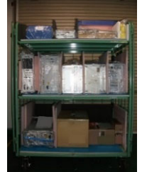
カーゴへの積荷風景

無梱包輸送とは、特殊な輸送技術により、精密機器等を梱包せずに、または簡易梱包のみで運ぶことができる輸送方法です。梱包資材はもとより 梱包に伴う作業が大幅に削減 できる本サービスを、ぜひご利用ください。