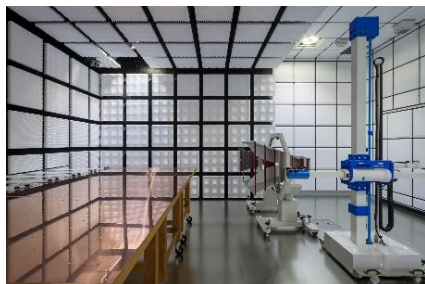
メーカーごとの異なるスペックに対応可能な車載機器専用電波暗室

電気自動車（EV）、自動運転などに代表される高度な技術発展に伴う、自動車産業独自の厳しい試験要求に対応した EMC試験サービスを、東京・名古屋・大阪の各拠点にて提供しています。